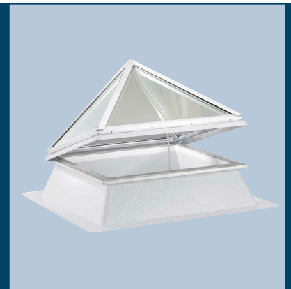
ESSMANN Glaspypamide Typ 2004/45

ESSMANN Glaspypamiden werden als 4-seitige, quadratische Pyramiden mit einem Neigungswinkel von 45° ausgeführt. Sie bestehen aus einer hochwertigen 24 mm dicken Isolierverglasung. Die innere Scheibe wird als Verbundsicherheitsglas (VSG) ausgebildet. Die Tragkonstruktion besteht aus einer thermisch getrennten Aluminium-Profilrahmenkonstruktion.